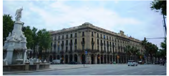
Porxos d'en Xifré