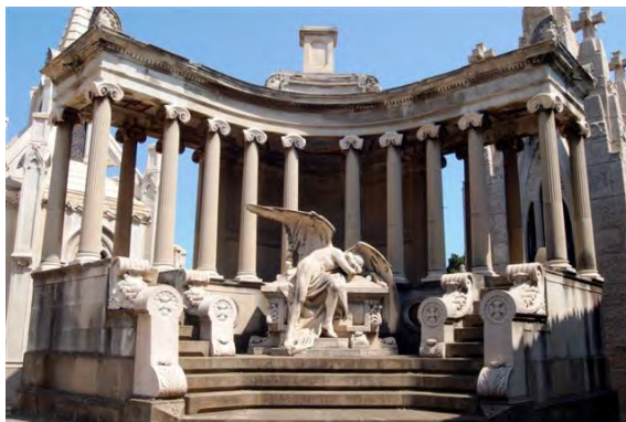
Panteó Urrutia. Cementiri de Montjuïc

I l'arquitectura funerària? Els indians i criolls més