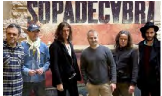
Els sis components de l'actual formació a la presentació del seu darrer disc El Retorn

Després del gran èxit en el seu retorn els sis membres de l'actual formació van presentar, el passat 13 de desembre un nou disc que, sota el nom El Retorn (Warner/Música Global), integra dos CD amb vint i cinc temes enregistrats durant els tres concerts al Palau Sant Jordi de Barcelona, un DVD amb vint i dos temes del concert del dia 9 de setembre, també al Palau Sant Jordi, i un documental sobre el grup.