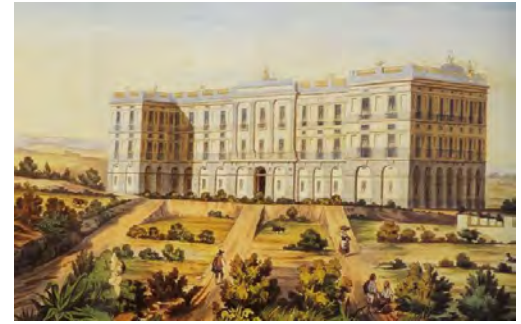
Gravat de l'Hospital d'Arenys de Mar

Ara bé, malgrat aquesta caracterització pròpiament romàntica dels indians, el fet cert és que aquest arquetipus llegendari no mostra tota la riquesa i tots els matisos d'aquests personatges. Ans al contrari, mostra una imatge poc representativa del que foren i el