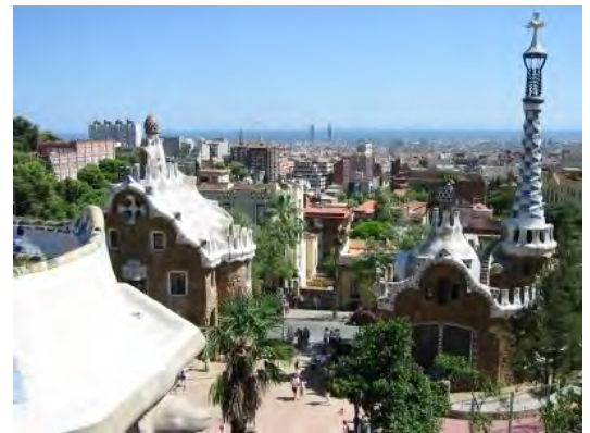
Vista aèria. Parc Güell

Incloem en aquest apartat els pavellons artístics d'empresaris indians a l'Exposició Universal de 1888: el de la Companyia Trasatlàntica dissenyat per Gaudí, que com el de Tabacs de Filipines venia de les exposicions del 1887 de Madrid i Cadis; el d'hidrocarburs de Catasús y Companyia, que va rebre una medalla d'or, i el de tabacs de José Gener, amb una rèplica reduïda de l'estàtua de Colom de Rafael Atxé que avui llueix en una façana de l'Arboç del Penedès.