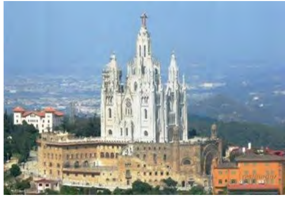
Sagrat Cor. Tibidabo